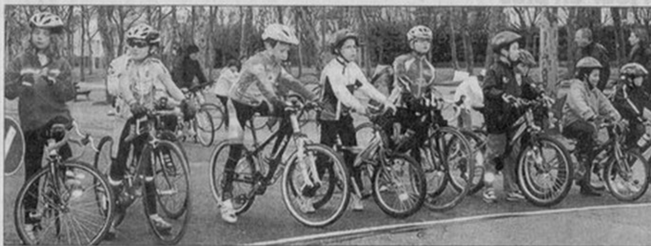
■ Les plus jeunes prendront le départ à 10 h.